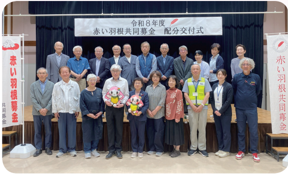
赤い羽根共同募金 配分交付式