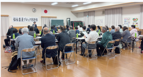
福祉委員ブロック別研修会

合併20周年を迎え、職員研修を行い“社協のすべきこと・求められていること、これからの社協のあるべき姿”について学び、引き続き地域福祉の推進に邁進していきます。