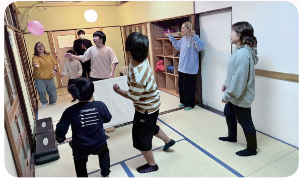
助成金で整備した交流スペースで笑顔の交流