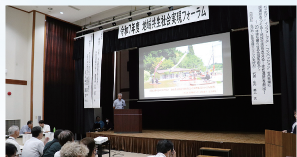
地域共生社会実現フォーラム